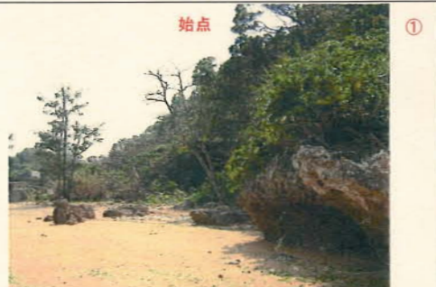
現地写真1 (海岸線形態及び施設)